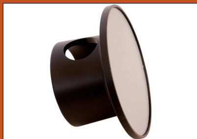
Slappuk kegle adaptor