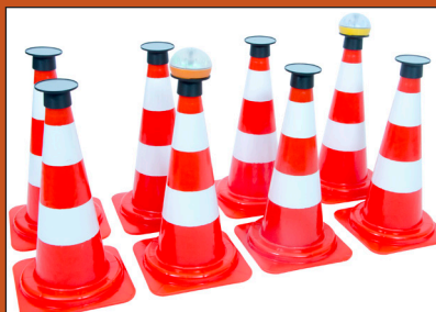
Slappuk kegle adaptor incl. kegle