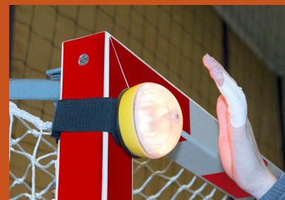
Slappuk adaptorplade m/velcro